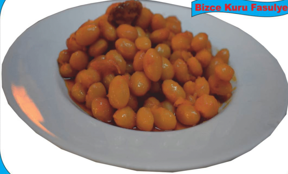
Bizce Kuru Fasulye

"Dünyaca Ünlü Meşhur Çayeli Kurufasülyesi"